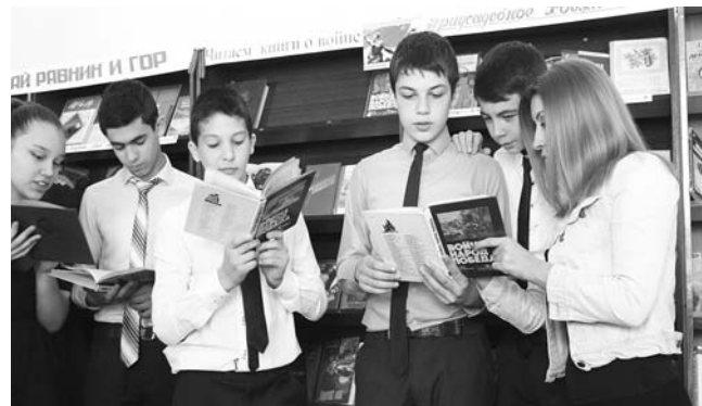
Одинаково для всех нас.

Значение подобных мероприятий трудно переоценить, ведь, несмотря на стремительно меняющийся век, память о той страшной войне должна быть долгой.